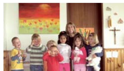
Die Mitarbeiterinnen des Kindergartens durften sich bei der heurigen KIM-Ausstellung ein Bild aussuchen.